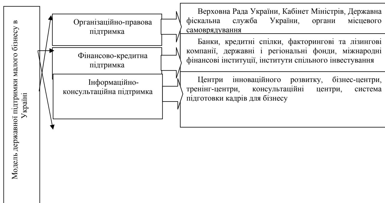
Рис. 2. Модель державної підтримки розвитку малого бізнесу в Україні

Загальна модель підтримки малого бізнесу в Україні наведена на рис. 2.