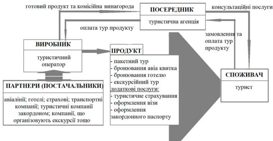
Рис. 2. Суб'єкти та об'єкти ринку туристичних послуг (розроблено автором)

зважаючи на можливості та потенціал. Тому аналіз галузі розпочинаємо з дослідження структури ринку, тобто хто є конкурентами, хто є споживачами, яким чином створюється продукт і реалізується, які ще суб'єкти впливають на функціонування ринку. Розглядаючи ринок туристичних послуг, пропонуємо розглянути структуру даного ринку (рис. 2).