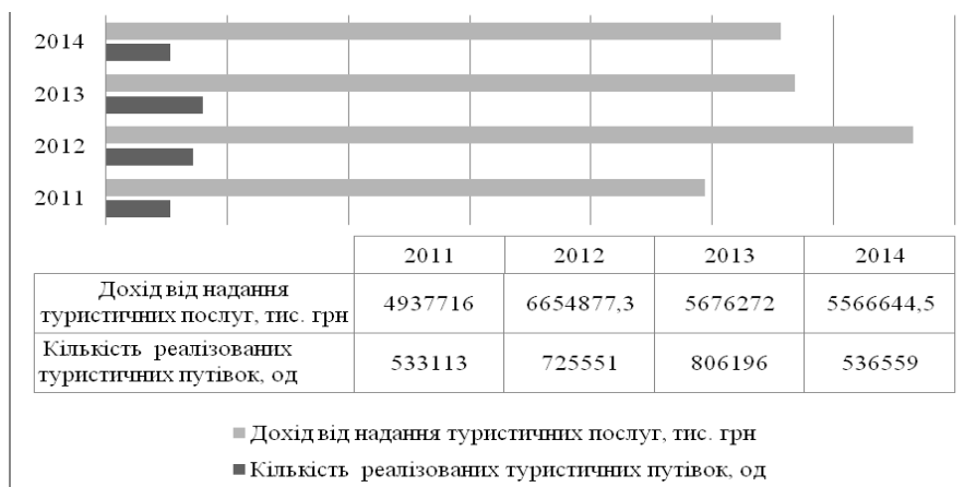
Рис. 3. Динаміка показників дохідності на ринку туристичних послуг за 2011—2014 рр. (складено автором за даними [12])

Тому можемо говорити, що зараз туристична галузь знаходиться на стадії зрілості, і необхідно шукати нові напрямки для розвитку, дослідити, які нові тенденції характерні для ринку, яким шляхом краще далі розвиватися.