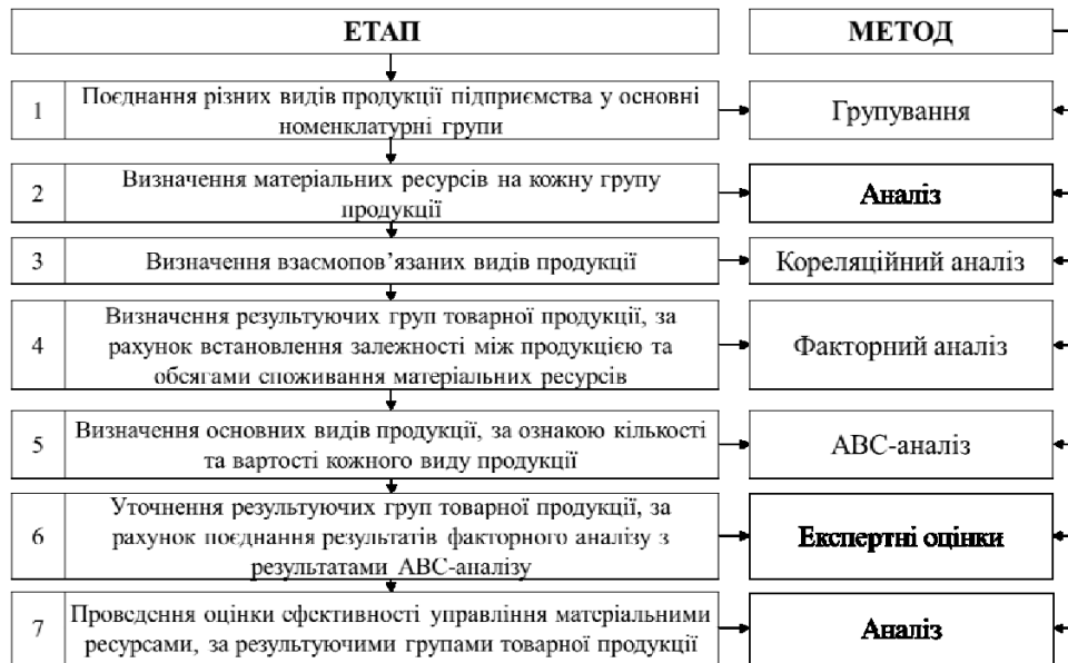
Рис. 2. Етапи синхронізації циклів відтворення матеріальних ресурсів та виробництва готової продукції

по випуску необхідного асортименту продукції, оптимальної взаємодії між підприємствами-постачальниками та підприємствами-споживачами, а також іншими елементами системи, з метою підвищення надійності системи і мінімізації її загальних втрати.