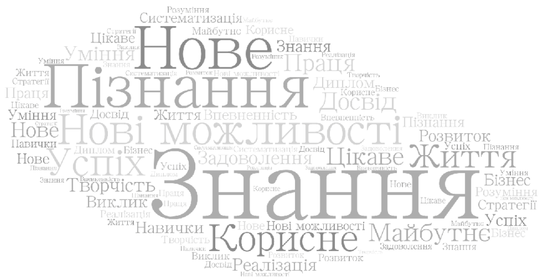
Рис. 2. «Хмара» визначальних характеристик ціннісних очікувань учасників опитування щодо ціннісного профілю магістерської програми «Стратегія та розвиток бізнесу»