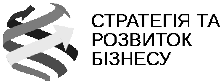
Рис. 4. Логотип магістерської програми «Стратегія та розвиток бізнесу» ДВНЗ «КНЕУ імені Вадима Гетьмана [11]

З урахуванням отриманих ціннісних характеристик учасниками проекту було розроблено логотип магістерської програми (рис. 4).