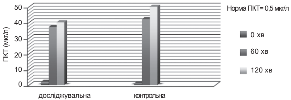
Діаграма 2. Показники прокальцитонінового тесту

ляопераційного періоду, кількість випадків ателектазів з 56% до 32%, зменшили різницю альвеоло-артеріальної різниці напруження кисню, що запобігає зменшенню індексу оксигенації. Показники прокальцитонінового тесту були на 20% нижчими, ніж у контрольній групі, що свідчить про зменшення кількості запальних процесів у післяопераційному періоді.