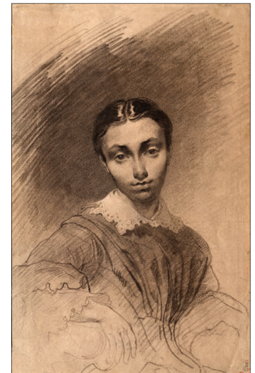
Т. Шевченко. Портрет К. А. Бажанової. Тонований папір, італійський олівець. 1854

Свідоцтво про державну реєстрацію: КВ №16782-5354 ПР від 22.04.2010