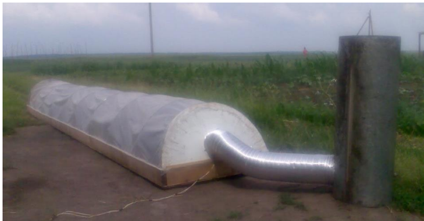
Рис. 1 – Загальний вигляд лабораторної установки сушарки із сонячним тепловим колектором

Для дослідження процесу приготування сушильного агенту використовували лабораторну установку сонячного теплового колектору (рисунок 2). Лабораторна установка складається з наступних елементів: дерев'яного каркасу, теплоізоляції, світло відбивного покриття, поглинаючого тіла, у вигляді металевої стружки, металевої сітки, що притискає стружку до дна колектору та світлопрозорого покриття зверху колектора. Теплова ізоляція (може бути пінопласт, мінвата, скловата, товщиною 50 – 100 мм) вкладається в нижній частині корпусу, а зверху покривається світло відбивним покриттям для зменшення теплових втрат.