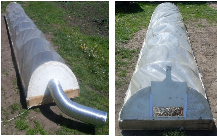
Рис. 2 – Лабораторна установка сонячного теплового колектору

Для дослідження процесу приготування сушильного агенту у сонячному тепловому колекторі, застосовували математичний метод планування експерименту із використанням симетричного не композиційного плану реалізації експерименту Бокса-Бенкіна другого порядку [4]. Метою експерименту було визначення температури приготованого сушильного агенту при варіюванні таких факторів як температура навколишнього середовища, робоча площа колектору та витрата повітря сонячного колектору. Для отримання математичної моделі процесу нагріву сушильного агенту, шляхом пропуску повітря через сонячний колектор було проведено трьох факторний експеримент.