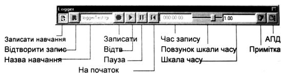
Рис. 1. Журнал (Logger) для запису та відтворення перебігу гри.

У системі Battle Command є інструменти оцінки результативності виконання, які допомагають переглянути гру під час її перебігу та після її завершення. У вікні аналізу проведених дій відображається кілька різних звітів, у яких підсумовується ступінь ведення вогню та втрати підрозділу за час сеансу моделювання. Для того, щоб відкрити вікно АПД, необхідно натиснути на кнопку ААР (АПД) на панелі інструментів Журнал (Logger). Загальний вигляд журналу системи Battle Command зображений на рис. 1 [5].