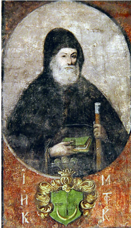
Рис. 4. Портрет ігумена Інокентія Монастирського. Темпера, XVII ст. Написаний на замовлення Дмитрія Туптала.

Саме тоді на південній стіні кирилівського храму з розпорядження ігумена Дмитрія Туптала було створено портрет 14 кирилівського ігумена Інокентія Монастирського – його доброго друга. Інокентій Монастирський помер у 1697 р., і після нього Дмитрій Туптало прийняв ігуменство в Кирилівському монастирі.