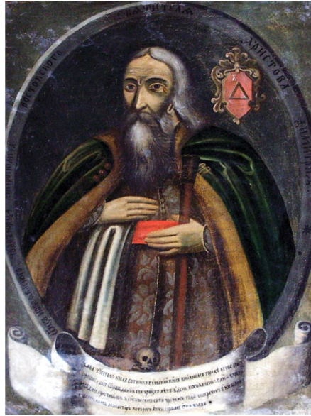
Рис. 5. Портрет Сави Туптала – ктитора Кирилівського монастиря, батька святителя Димитрія Ростовського.

Після багаторічних митарств дорогами війни Сава повернувся до Києва та з честю відбув службу. У 85 років він іздив верхи, збирав «митне» – плату за переправу через річку Ірпінь. Сотник Сава Туптало був заможним шляхтичем, ревним і благочестивим християнином. Разом із дружиною вони виховали чотирьох дітей: трьох дочок і сина Данила, які присвятили своє життя радикальному наслідуванню Христа – прийняли постриг. Сам Сава Туптало був чоловіком щедрим та, вподобавши собі Кирилівський монастир, 1687 р. став його ктитором. У Києві він побудував жіночу Йорданську обитель, у якій служили ігуменями три його доньки. Сава Туптало упокоївся на 104-му році життя на свято Богоявлення. Сім'я Тупталів була відома в Києві щедрим меценатством і поборництвом православія. Вони давали гроші на утримання Києво-Могилянської академії, Кирилівської церкви, а свій двір і будинок Сава відписав подільській церкві Миколи Притиска. Рід Тупталів мав свій герб – червоний щит, на якому зображено грецьку букву «дельта» з православним хрестом над нею. На гербі Сави Туптала була також грецька літера «сигма».