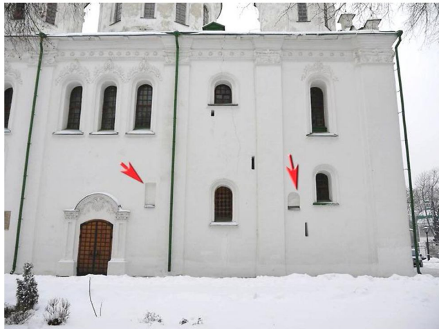
Рис. 2. Кирилівська церква. Північний фасад. Ніші для пам'ятних образів.

Поховання князів із роду Ольговичів започаткувало історію некрополя в Кирилівському храмі 2 . З похованнями XVII–XVIII ст. пов'язані ікони (образи святих на мідних дошках), встановлені в північній стіні Кирилівського храму. У наших дослідженнях ми вже зверталися до цих ніш 3 , але тривав науковий пошук, і з'явилися нові свідчення, та головне – бажання відтворити пам'ятні дошки, які колись були ознакою храму.