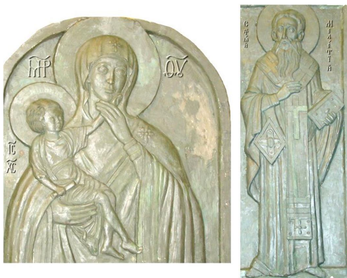
Рис. 10. Взірці ікон. Пластилін. Автор – скульптор О. Моргацький.