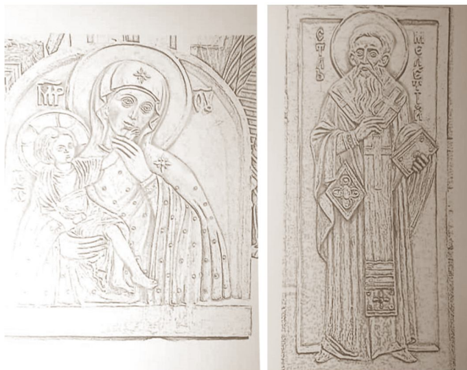
Рис. 9. Креслення образів. Автор – скульптор О. Моргацький.