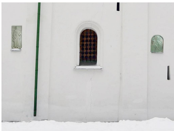
Рис. 11. Віртуальна реконструкція пам'ятних образів.