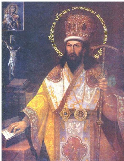
Рис. 3. Портрет святителя Димитрія Ростовського.

Одначе, чи був Мелетій Дзик справді похований у Кирилівській церкві, як свідчить вищенаведений документ? Певний час, спираючись на цей документ, ми вважали, що видатний церковний діяч, друг святителя Димитрія Ростовського ігумен Мелетій був похова-