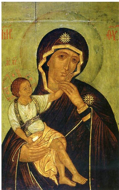
Рис. 7. Ватопедська Божа Матір. Родова ікона родини Тупталів.