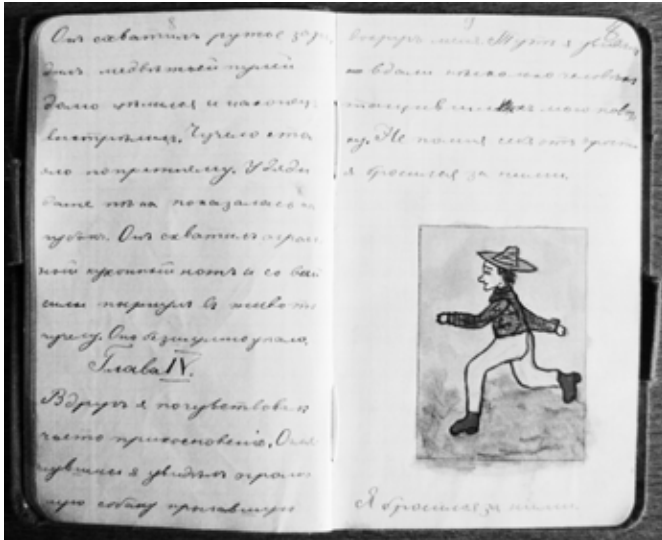
Федір Ерст. «Я бросился за ними». Ілюстрація до роману «Приключения Джека Гольта». 1903 р. Папір, туш, білило, акварель