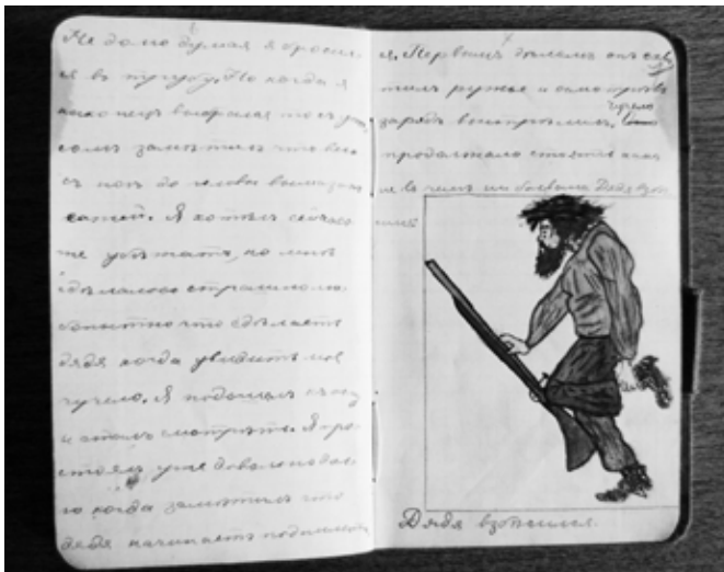
Федір Ерст. «Дядя взбесился». Ілюстрація до роману «Приключения Джека Гольта». 1903 р. Папір, туш, акварель