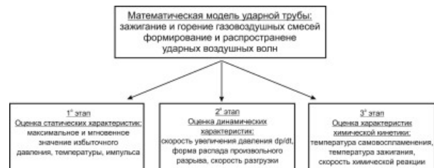
Рис. 1. Этапы оценки адекватности математической модели ударной трубы / Stages of assessing the adequacy of the mathematical model of the shock tube

Поскольку в рассматриваемом процессе важны не только количественные параметры ударных воздушных волн и фронта горения (максимальное и мгновенное значение избыточного давления, температуры, импульса и др.), а и динамические характеристики процесса (скорость увеличения давления dp/dt , скорость химической реакции, скорость разгрузки и др.), а также характеристики химической кинетики, то оценку адекватности математической модели предлагается разделить на три этапа (рис. 1).