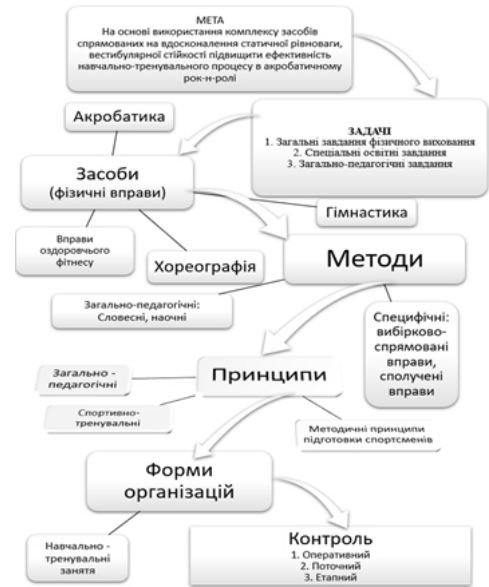
Рис. 1. Структура методики вдосконалення функції рівноваги тіла

Для поступового збільшення навантаження в доцільному поєднанні використовувалися: а) збільшення темпу виконання; б) збільшення кількості повторень і кількості