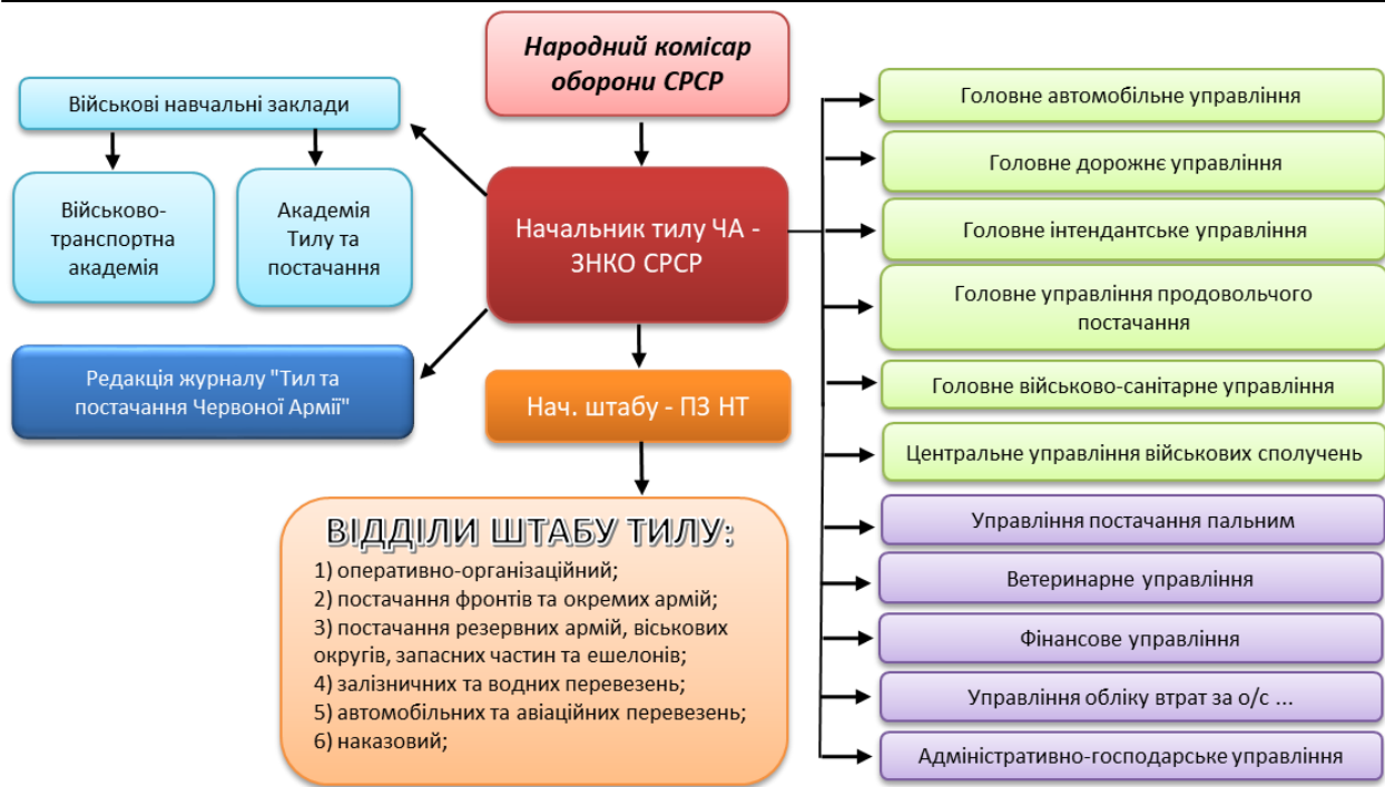
Рис. 1 – Структура органів військового управління тилу відповідно до напрямів реформування збройних сил (розроблено автором)

Узагальнюючи проблематику заключного етапу радянсько-німецької війни, можна констатувати, що труднощі тилового забезпечення були спричинені насамперед стрімкими наступальними діями військ.