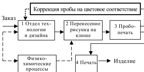
Рис. 1. Общая схема печатного производства

Общая схема печатного производства представлена на рис. 1. Основные проблемы цветопередачи формируются на участках 1, 3.