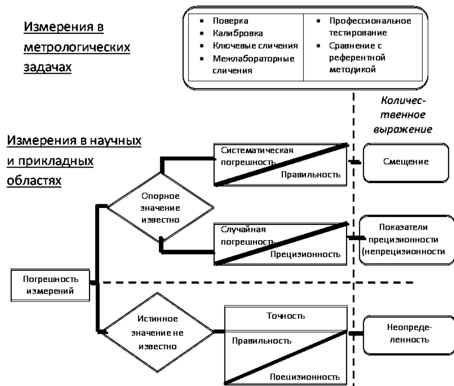
Рис. 1. Понятия, связанные с погрешностью измерения

Понятия, связанные с погрешностью измерения, включая те из них, которые относятся к количественному выражению погрешности, схематично представлены на рис. 1.