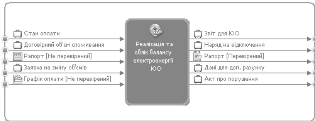
Рис. 1. Контекстна діаграма процесу реалізації електроенергії юридичним особам виробничої дільниці енергопостачальної компанії

Контекстна діаграма для етапу виконання процесу реалізації електроенергії юридичним особам виробничої дільниці енергопостачальної компанії представлена на рис. 1, на якому також відображені всі можливі входи та виходи для даного бізнес-процесу.