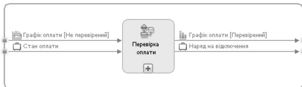
Рис. 2. Контекстна діаграма підпроцесу перевірки оплати за використану електроенергію юридичною особою

Одна виробнича дільниця енергопостачальної компанії обслуговує близько 150 юридичних осіб. Абонент може сплачувати за спожиту електроенергію у декілька етапів. Тобто оплата та відповідна перевірка оплати для деяких юридичних осіб може здійснюватись декілька разів на місяць. На виході підпроцесу маємо перевірений графік оплати та, якщо абонент має заборгованість, наряд на відключення споживача.