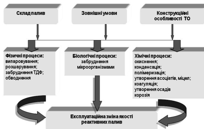
Рис. 1. Чинники та процеси, які впливають на експлуатаційну зміну якості реактивних палив протягом «життєвого циклу»

Склад забруднень значно залежить від води, що використовується для промивання. При цьому, в паливах значно збільшується кількість часток механічних домішок розміром до 5 мкм [4, 5]. Склад пе-