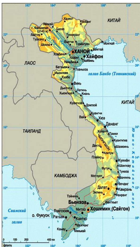
Рис. 1. Географическая карта Вьетнама

• уровень полных и среднеквадратических погрешностей оценок вектора состояния неподвижного потребителя при наличии как систематических, так и случайных погрешностей наблюдения кодовых псевдодальностей и фазовых псевдоскоростей.