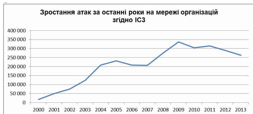
Рис. 1. Графік зростання атак на інформаційні системи та мережі за останні роки

На рис. 2 зображена архітектура типових систем виявлення вторгнень.