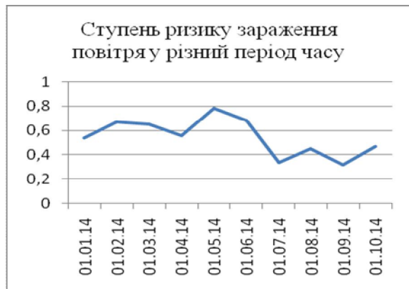
Рис. 2. Ступінь ризику зараження повітря у різний період часу G_n