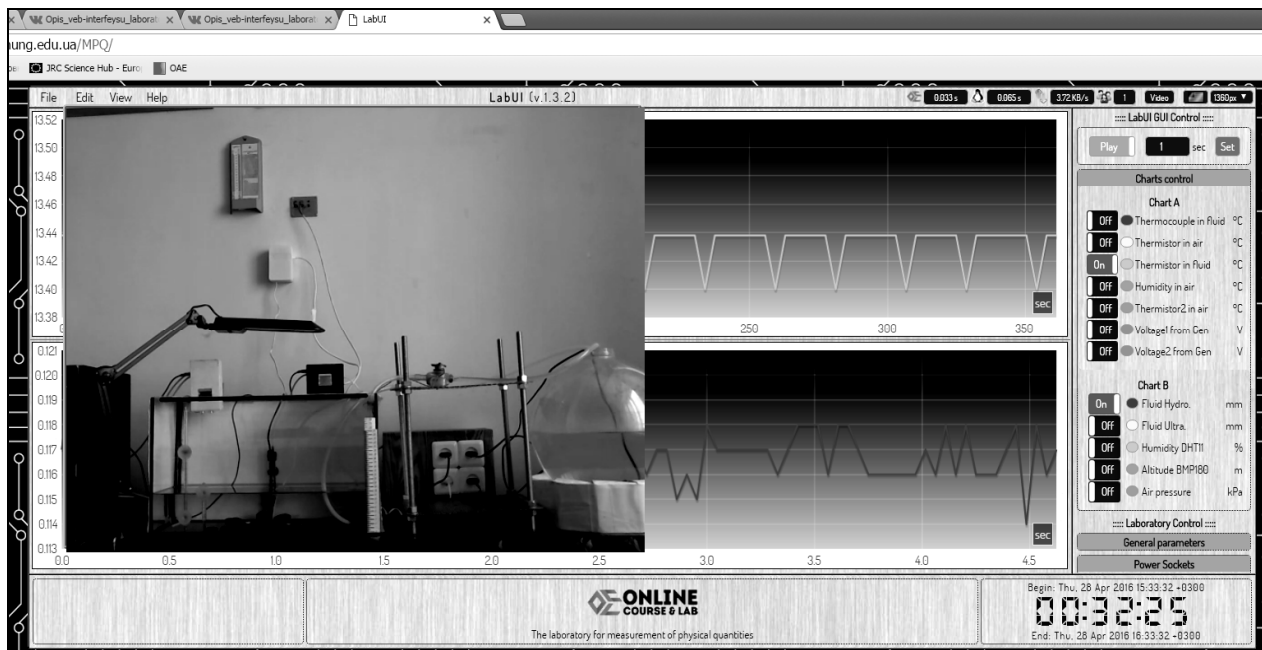
Рис. 1. Веб-інтерфейс лабораторії для вивчення методів вимірювання основних технологічних параметрів

- дослідження ефективності перетворення електричної енергії від гідроелектрогенератора в нормований сигнал в залежності від параметрів потоку рідини;