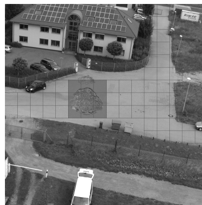
Рис. 2. Полученная схемокарта

Keywords: decisive rules base, fuzzy logic, schematic map, pavement, classification features.