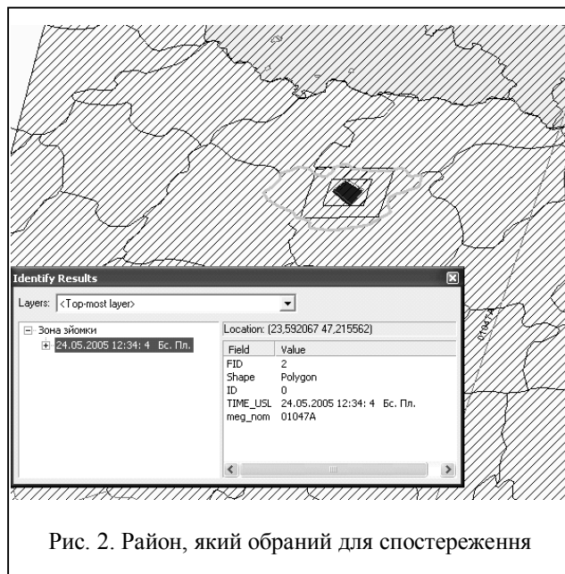
Рис. 2. Район, який обраний для спостереження