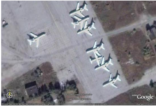
Рис. 3. Космічний знімок (1), що отримано з комерційного КА

Можливість використання супутникових даних для вирішення задач ПС можливо оцінити по космічним знімкам, що отримано від одного з комерційних КА з тактико-технічними характеристиками, що аналогічні тактико-технічним характеристикам КА типу «Січ» (рис. 3, 4).