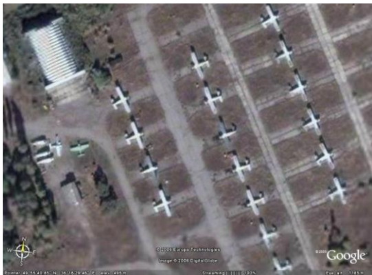
Рис. 4. Космічний знімок (2), що отримано з комерційного КА

Приведені космічні знімки свідчать про можливість надійного виявлення з борту КА літаків і різних наземних об'єктів, їх розпізнавання та виміру координат. Основний ефект від використання космічних даних полягає у наступному: