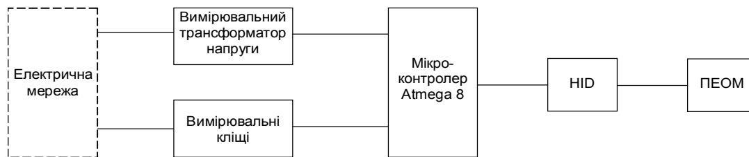
Рис. 3. Структурна схема пристрою для вимірювання показників якості електричної енергії

Delphi 7.0 дозволяє за допомогою стандартного модуля CANVAS достатньо наочно відобразити сигнал, прийнятий з пристрою.