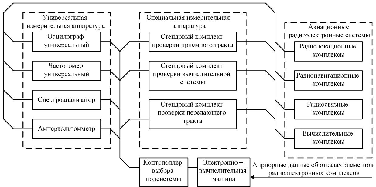
Рис. 2. Перспективная система контроля работоспособности и диагностики АРЭС. Схема электрическая структурная

При этом будут использованы алгоритмы, следующие из минимизации одного из наиболее распространенного в теории радиолокации и связи критерия среднего риска: