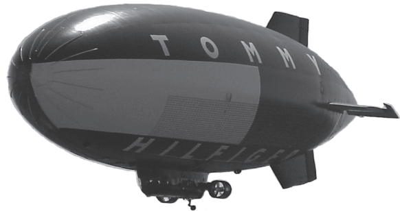
Рис. 1. Прив'язний аеростат Au-17

рення і експлуатацію аеростатів як транспортних засобів. Це відчутно вплинуло на використання аеростатів в якості аероплатформ для телекомунікаційних цілей.