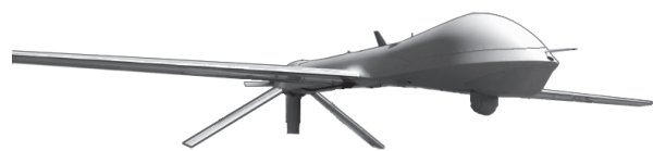
Рис. 2. БпАК Predator RQ-1

Важливою віхою у створенні аероплатформ стало використання економічних безпілотних літаків. Так, в якості середньопіднятої аероплатформи компанія General Atomics пропонує БпАК Predator RQ-1 (рис. 2).