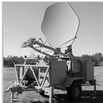
Рис. 1. Станция DART-T (США)

ант станции позволяет развертывать АМУ на расстоянии 2 км от аппаратной машины, а соединение обеспечивается волоконно-оптическим кабелем. Станция DART-T (США) диапазона 14 ГГц (Band V) является примером комбинированной радиосистемы СВЧ диапазона и может работать в двух режимах: в тропосферном и спутниковом, что повышает устойчивость связи военной системы связи (рис. 1).