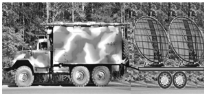
Рис. 3. Конструктив разработанной цифровой тропосферно-радиорелейной станции на базе РРС Р-409