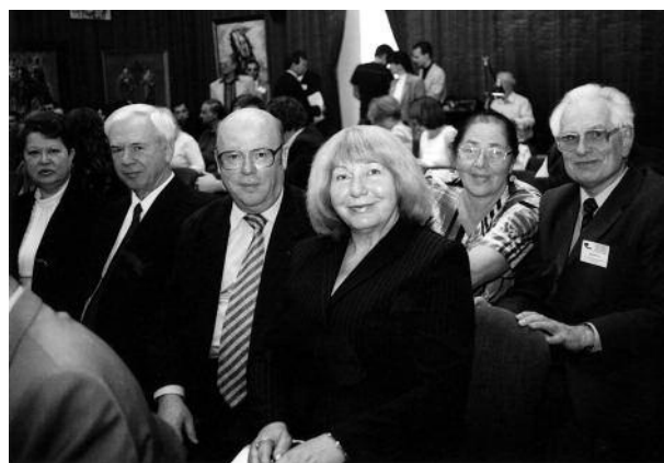
Фото 9. Сотрудники клиники на съезде токсикологов

Результаты обследования с разработкой и внедрением новых методов лечения больных с интоксикациями пестицидами обобщены в