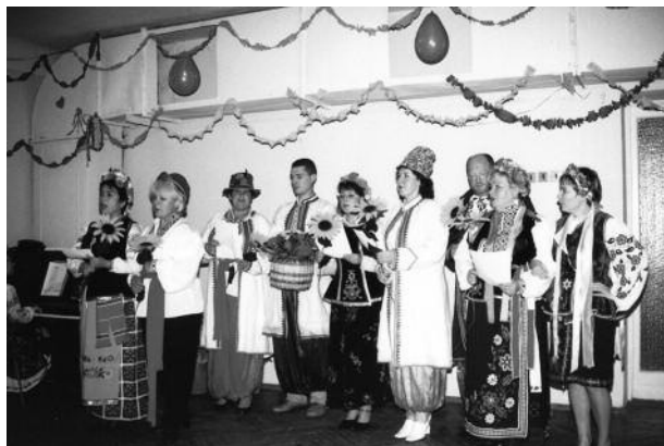
Фото 7. Сотрудники клиники принимали активное участие в художественной самодеятельности института

Установлен также существенный рост желудочно-кишечных заболеваний, преимущественно за счет хронических гастритов с различным нарушением секреторной функции желудка и поджелудочной железы с ростом частоты дисбактериоза кишечника [47, 48].