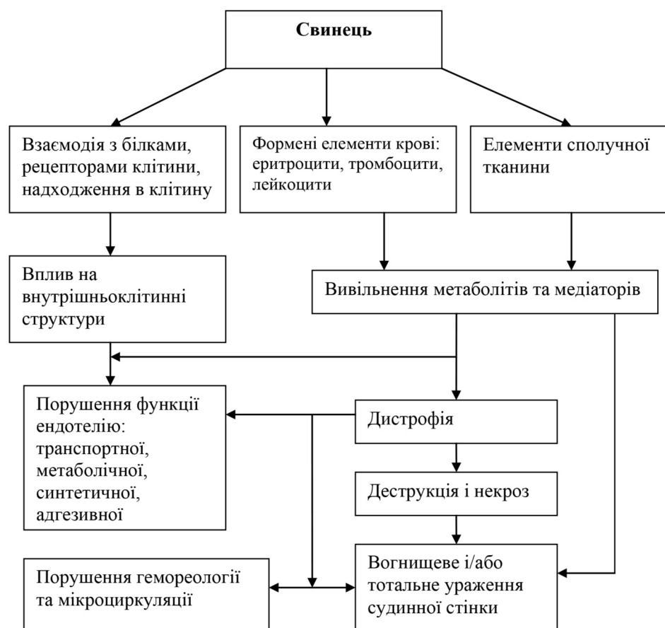
Рис. 3. Узагальнені механізми вазотоксичної дії свинцю

Свинцева інтоксикація насамперед спричинює ряд гістологічних перебудов у стінці тонкої кишки. Встановлені морфологічні зміни, що характеризуються запальними дистрофічними явищами, при яких потовщується надепітеліальний шар слизу. Зв'язуючи надлишок свинцю, слиз перешкоджає його всмоктуванню. В епітелії слизової оболонки тонкої кишки спостерігаються ознаки зернистості та вакуольної дистрофії, набряк цитоплазми клітин з формуванням в них вогнищ некрозу. У криптах відмічається значне збільшення апоптотичних тілець. На фоні свинцевої інтоксикації знижується активність ферментів, а саме амілази, що є наслідком інгібування їхньої активності за рахунок реакції металу з SH- гру-