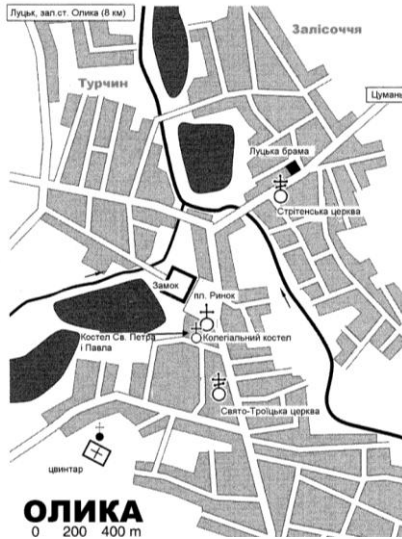
Рис. 2. План с.Олика

Олика – історично збагачене місце (рис.2), центр, який об'єднує в собі визначні пам'ятки архітектури. Саме історичні пам'ятки надають особливість цьому місцю та підкреслюють його унікальність.