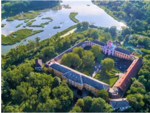
Рис. 3. Олицький замок з висоти пташиного польоту

Пропозиції. Для підкреслення особливостей та покращення статусу смт. Олика потрібно провести такі дії.