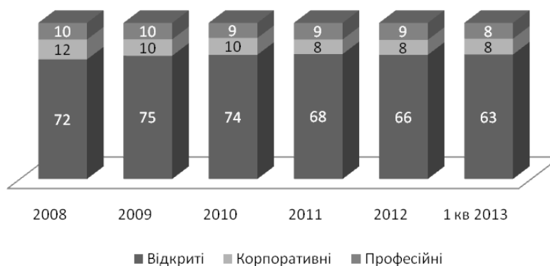
Рис. 1. Кількість НПФ в розрізі видів фондів за 2008-2013рр*

Останніми роками спостерігається тенденція до зменшення кількості НПФ, особливо відкритих недержавних пенсійних фондів (рисунок 1). Так, порівняно з 72 діючими відкритими НПФ в 2008 році, у першому кварталі 2013 року залишилося лише 63. Так, не зважаючи на посткризовий період, в 2009 році порівняно з 2008 загальна кількість недержавних пенсійних фондів зросла на одну одиницю та становила 95 НПФ. Але вже в 2010 загальна кількість НПФ зменшилась на 2 фонди. Аналогічне зменшення відбулося і в 2012 році. Найбільш різким було зменшення загальності кількості НПФ у 2011 році (8 фондів). Як свідчать статистичні дані 2013 рік не буде сприятливим для збільшення кількості НПФ в Україні, адже лише протягом першого кварталу відбулося скорочення на 4 фонди.