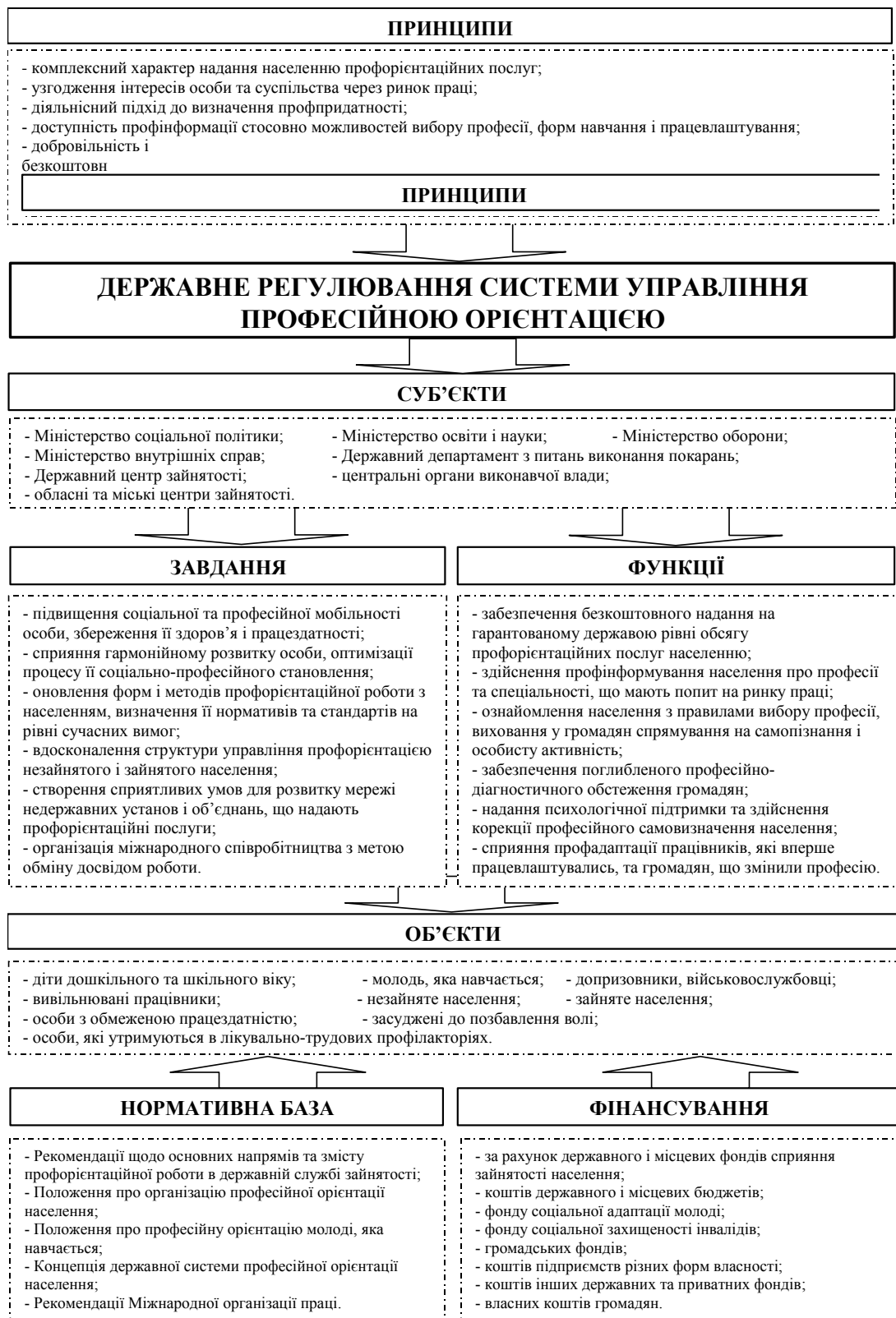
Рис. 1. Державне регулювання системи управління профорієнтацією

Протягом 2013 року профорієнтаційні послуги Державної служби зайнятості отримали близько 4,2 млн осіб, з яких 1,5 млн мали статус безробітного, у т. ч. 231,7 тис. осіб, які не мали професії або спеціальності. У 2013 році профорієнтаційними послугами було охоплено 661 тис. осіб у віці до 35 років. Крім того, профорієнтаційні послуги також отримали близько 1,6 млн осіб, які навчаються у навчальних закладах різних типів, зокрема майже 1,4 млн учнів загальноосвітніх навчальних закладів. Проаналізуємо чисельність осіб, охоплених профорієнтаційними послугами, у 2012—2013 рр. у регіональному розрізі (рис. 2). Найбільша