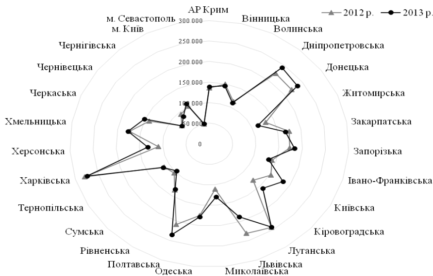
Рис. 2. Чисельність осіб, охоплених профорієнтаційними послугами у 2012—2013 рр. у регіональному розрізі, осіб

чисельність осіб, охоплених профорієнтаційними послугами у 2013 р., спостерігається у Харківській (273,7 тис. осіб), Дніпропетровській (242,3 тис. осіб), Луганській (242,2 тис. осіб), Донецькій (236,6 тис. осіб), Полтавській (235,3 тис. осіб) області, найменша — у Чернівецькій (73,4 тис. осіб), Чернігівській (87,3 тис. осіб), Сумській (95,9 тис. осіб) області.