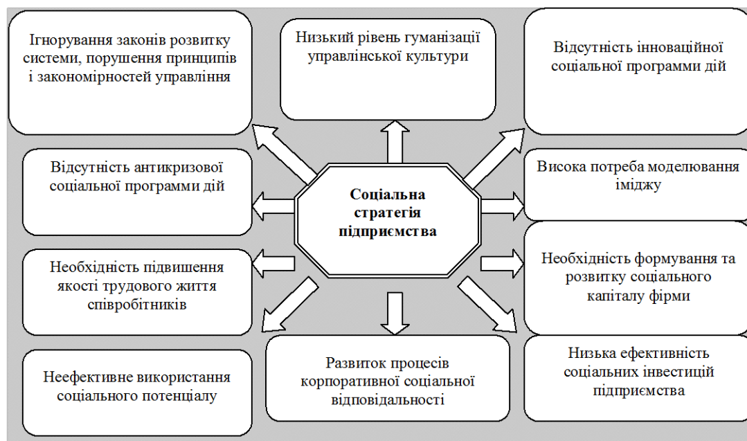
Рис. 1. Причини, що визначають важливість формування соціальної стратегії підприємства

Важливість формування соціальної стратегії визначається певними причинами, які представлено на рис. 1.