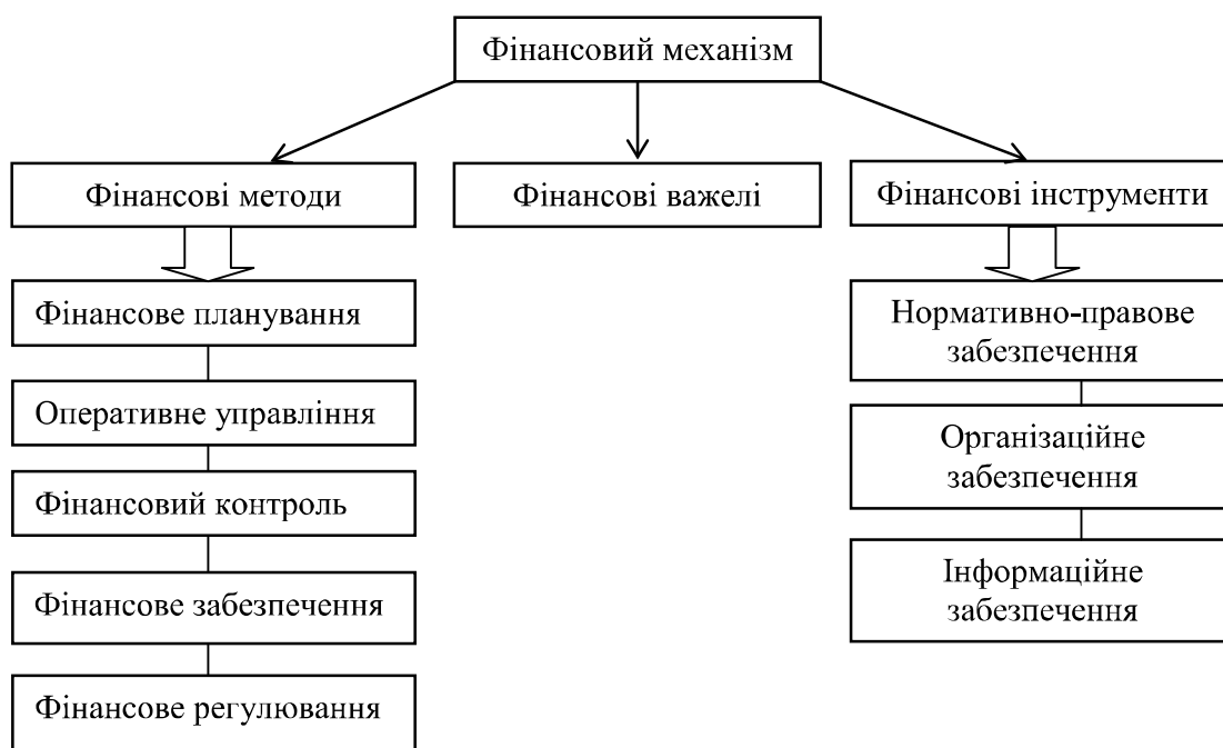
Рис. 1. Структура фінансового механізму [2]

Сприяти цьому повинна обґрунтована політика держави, зокрема за допомогою фінансово-економічних інструментів, оскільки їх використання спроможне знизити тиск на діяльність підприємств у пріоритетних галузях економіки і забезпечити їх інноваційний розвиток. Необхідно підтримувати ефективність функціонування фінансового механізму, що залежить від комплексного удосконалення його структурних елементів, серед яких вагома роль належить фінансовому регулюванню (рис. 1).