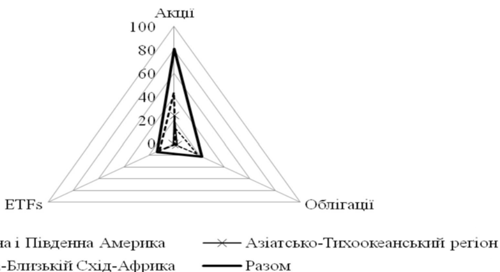
Рис. 1. Обсяги біржової торгівлі основними цінними паперами з географічним поділом у 2014 році (трлн. дол. США)*

1) Акції є основним інструментом біржової торгівлі, виступають локомотивом біржової діяльності та розвитку. Згідно зі звітами WFE у 2014 р. вартість біржових угод, предметом яких були акції, досягла 80,9 трлн. дол. США, що у 3,7 раза більше вартості угод за облігаціями та у 5,9 раза більше ніж вартість угод з ETFs (рис. 1).