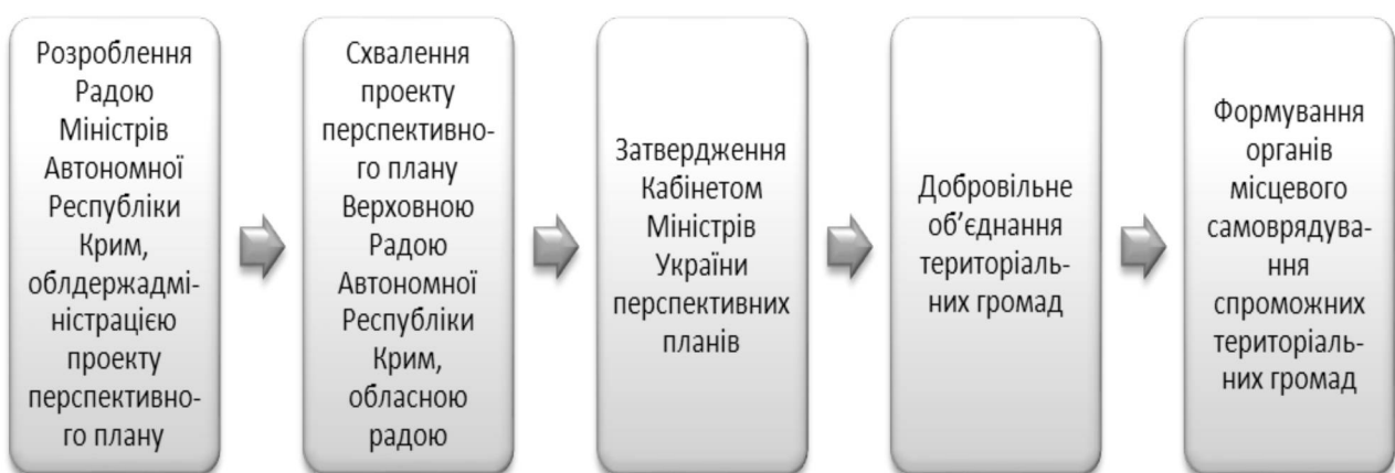
Рис. 1. Етапи формування спроможних територіальних громад*

Лідерами процесу об'єднання у 2015 р. стали Тернопільська та Хмельницька області, де, відповідно, утворено 26 та 22 громади. Проте жодної нема у Харківській області (рис. 2). Загальна площа всіх ОТГ становила 35807 км 2 6% від площі України (без урахування м. Києва та Автономної Республіки Крим). Найбільша за площею ОТГ – Народицька ОТГ Житомирської області, яка займає 1284 км 2 , найменша – Міженецька ОТГ Львівської області – 8,7 км 2 . Станом на 1 січня 2016 року чисельність населення, яке мешкало на території цих ОТГ, становила 1386,5 тис. осіб, що складає 3,8% від загальної чисельності населення України (без урахування м. Києва та Автономної Республіки Крим). Об'єднані територіальні громади суттєво відрізняються і за чисельністю населення. Найменша – Макіївська ОТГ Чернігівської області – 1,6 тис. жителів, найбільша – Лиманська ОТГ Донецької області – 44,2 тис. жителів (громада створена на основі міста-району) [4].