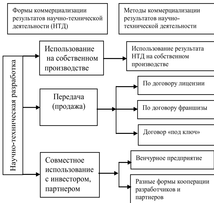
Рис.1. Формы коммерциализации результатов научно-технической деятельности составлено автором на основе [4- 6].

Реализация стратегического плана развития института будет осуществляться преимущественно за счет внутренних ресурсов и возможностей. Вместе с тем необходимо усовершенствовать нормативно-правовую базу деятельности научных организаций, а также определенных основ функционирования научно-технической и инновационной сфер в целом, которое будет нуждаться в поддержке со стороны законо-