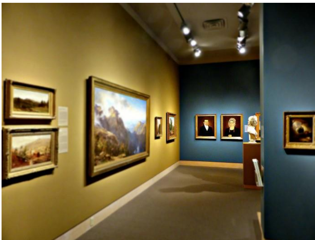
Рис. 2. Галерея Ісаака Мішка у Дартмутському коледжі

як колір впливає на звичайну людину і вашу цільову аудиторію. Головним фактором в кольоровому рішенні виставкового простору – це звернення уваги на експонат. Внутрішня середа виставки повинна підпорядковуватися експозиції. Колір і фактура ні в якому разі не повинні відволікати від експонованих об'єктів, а повинні доповнювати їх і акцентувати на них увагу.