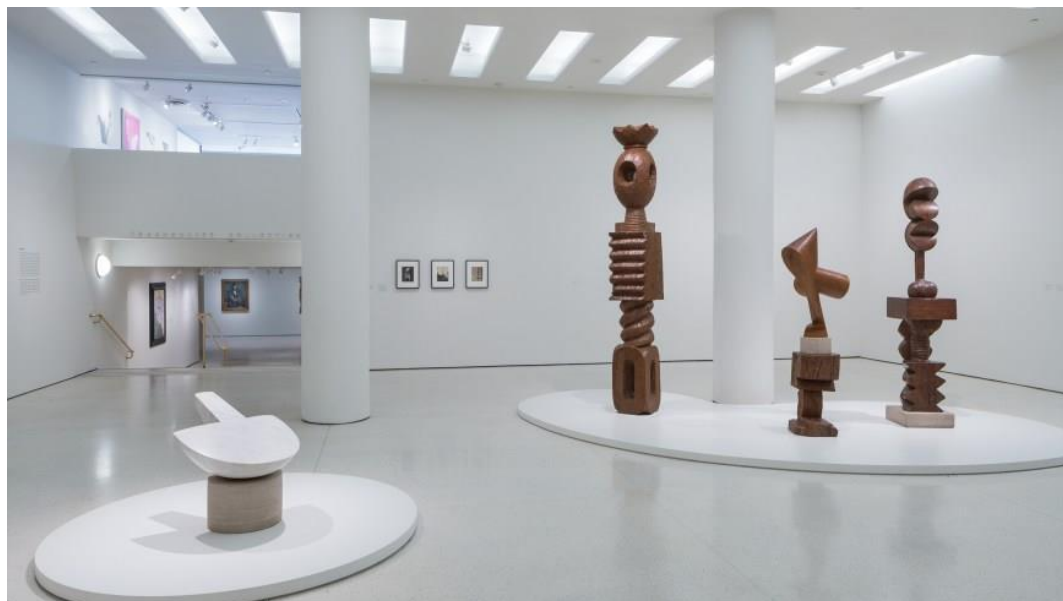
Рис. 3. Приклад застосування хроматичного фону стін. Музей Соломона Гуггенхейма в Нью Йорку

З цієї ж причини в виставковому просторі часто виключають драматичні та динамічні кольори стін: нейтральний колір має тенденцію відповідати більшій кількості різноманітних подій, ніж яскравий та сміливий. Білий колір має свої переваги і приносить певну користь для виставкового простору і експонатів різними способами. Наприклад, білий колір відбиває світло і робить простір більше і яскравіше, ніж він є (рис. 3).