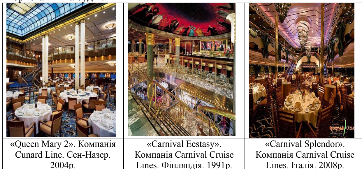
Рис.1. Інтер'єри в стилі Арт - деко на круїзних суднах

Цей стиль використовується на круїзному судні для того, щоб підкреслити всі надмірності перебування на кораблі. Дає можливість відчувати пасажиром себе пишно. Так само арт-деко підходить для оформлення інтер'єрів на судні тим, що меблі цього стилю різноманітні. Стільці можуть бути схожими на трон або бути більш мініатюрними і витонченими. Це дозволяє підібрати форму меблів відповідну для використання на судні.