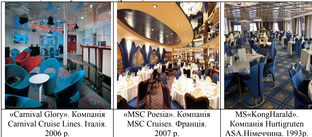
Рис.2. Інтер'єри виконані у морський тематики

Присутність кольорової гами "морської хвилі" в інтер'єрах круїзних суден робить упор на те, щоб пасажирам все вказувало на морський відпочинок. Колір морської хвилі охоплює велику гаму відтінків. Він коливається від глибокого синьо-зеленого відтінку до світлого, майже аквамаринового. Це колір приємний для сприйняття людиною і ніколи не набридає, він може бути як теплим, так і холодним, відмінно виглядає в інтер'єрі. Але використання морської тематики буває зображено, як натяками, так і буквальною (рис.2).