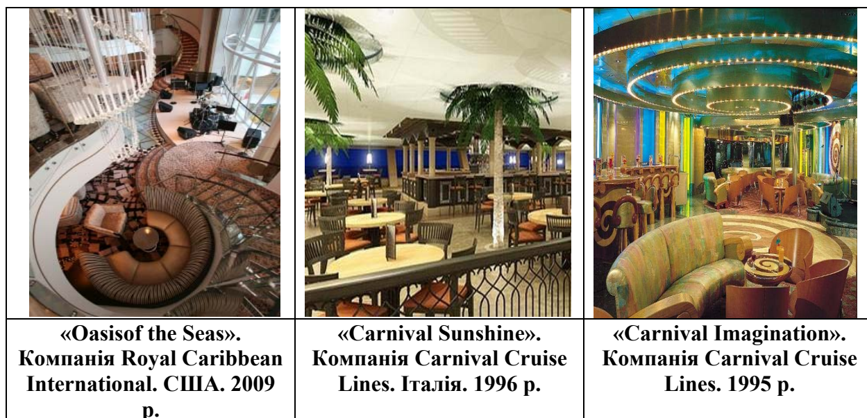
Рис.5. Використання образу природи в судових інтер'єрах

Велика увага приділяється рослинам на кораблі для створення добродійної екологічної атмосфери. Вони необхідні, так як підтримують необхідний психоемоційний комфорт в закритих приміщеннях (рис.5). У приміщеннях присутні рослини, якщо не живі, то штучні.