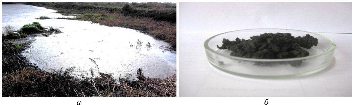
Рис. 3. Осад після біологічного очищення стічних вод – новоутворений осад на муловому майданчику (а) та осад, витриманий 12 місяців на муловому майданчику (б)

Виклад основного матеріалу. Для того, щоб дослідити безпечність для використання у сільському господарстві й будівництві АМ проведено дослідження ймовірної токсичності води, яка проходить крізь свіжий осад та осад після витримки у 12 місяців на мулових майданчиках і потрапляє у ґрунти. Для аналізу відбирали осад з мулового майданчика (ОММ), який має вигляд, представлений на рис. 3.