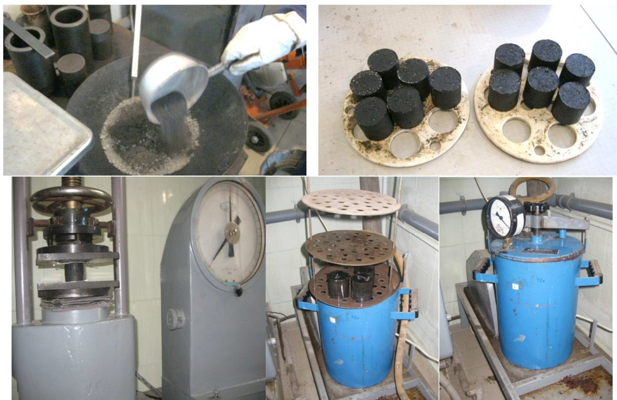
Рис. 4. Процес виготовлення експериментальних зразків 5 та 10 % виявлення фізико-механічних властивостей зразків ОМС з різним вмістом замітника мінерального порошку

Фізико-механічні властивості сумішей, асфальтобетонів і закріплених ґрунтів визначають на зразках, що отримані ущільненням сумішей у сталевих формах. Форми для виготовлення циліндричних зразків являють собою сталеві порожнисті циліндри, які можуть виготовлятися у вигляді касети з трьома взаємозв'язаними циліндричними формами діаметром 71,4 або 50,5 мм, або одиночних звичайних та полегшених форм, розміри яких залежать від найбільшої крупності мінеральних зерен.