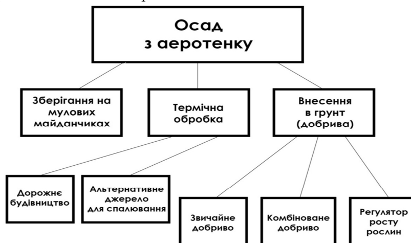
Рис. 2. Основні напрями утилізації осаду з аеротенку

Виділення не вирішених раніше частин загальної проблеми. Огляд літературних джерел щодо утилізації відходів біологічного очищення стічних вод виявляє три основні напрями, представлені нами на рис. 2.