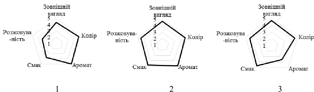
Рис. 3. Органолептичні профілі сушеної черешні:

1 – червона свіжа; 2 – червона заморожена; 3 – жовта свіжа