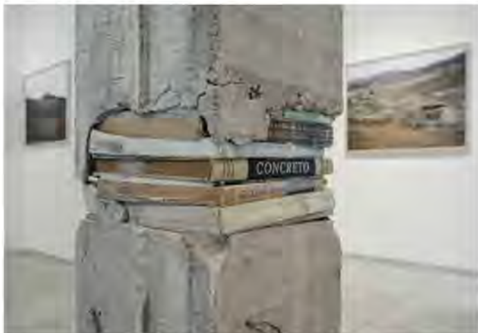
Рис. 2 Авторська робота Іумаель Рендел "We're stronger in the places that we've been broken." —Ernest Hemingway

Іншим є підхід до використання книги як модуля, без прив'язки до її призначення, тільки з використанням її форми. Художниця Алісія Мартін (Alicia Martin) по всьому світі створює торнадо з книжок, які "випливають" з вікон, як вода з гігантського шлангу (рис. 3. а).