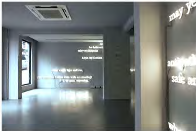
Рис. 8. Джозеф Кошут (Joseph Kosuth) – «The wake».