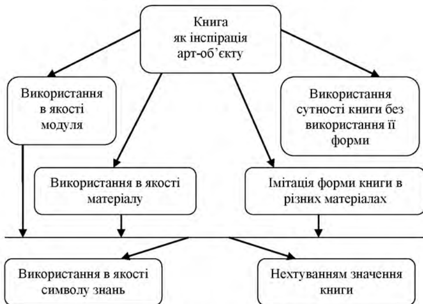
Рис. 9. Книга як інспірація арт-об'єкту