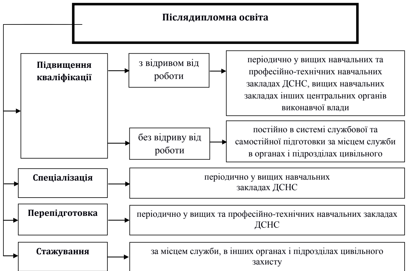
Рис. 4. Структура післядипломної освіти осіб рядового і начальницького складу