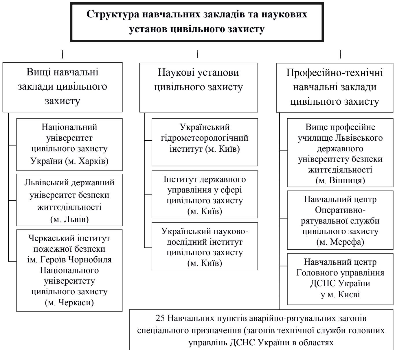
Рис. 2. Структура навчальних закладів та наукових установ цивільного захисту