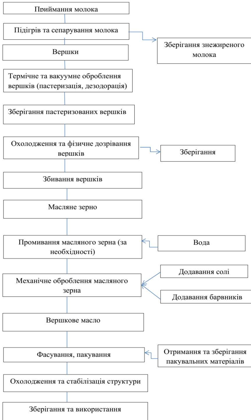
Рис. 1. Блок-схема виробництва масла вершкового.

До загальних підготовчих операцій виробництва масла належать: приймання та підготовка сировини, отримання вершків традиційної жирності, пастеризація і дезодорація вершків. Метод збивання вершків передбачає операції фізичного дозрівання; збивання вершків; промивання масляного зерна (за необхідності); соління (для солоного масла); додавання барвника (за необхідності); механічного