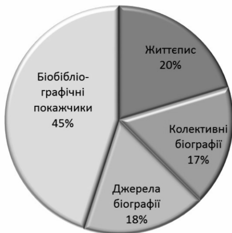
Рис. 1. Розподіл поданих до Рейтингу видань за типом

Таким чином до «довгого списку» були відібрані 211 видань, згруповані за визначеними експертами критеріями у відповідні їхнім характеристикам номінації. Зазначимо, що до номінації «Життєпис» (видання, присвячені одній особі) увійшли 43 надходження, до «Колективні біографії» (видання, присвячені групі чи сукупності персоналій) — 36, «Джерела біографії» (джерелознавчі видання різних жанрів) — 37 та «Біобібліографічні покажчики» (бібліографічні видання різних жанрів) — 95.