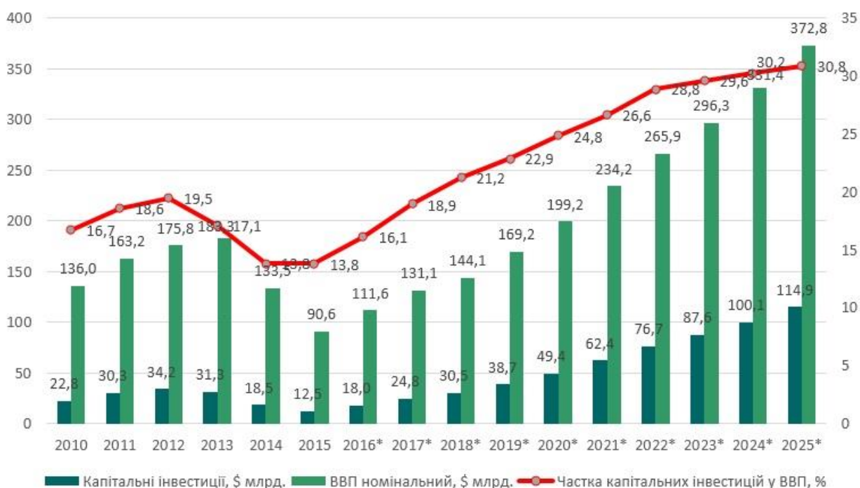
Рис. 4. Капітальні інвестиції та ВВП (прогноз) [2]

За таких обставин державне регулювання інвестиційної діяльності потрібно спрямувати на управління інвестиціями, а також – на контроль за законністю здійснення інвестиційної діяльності всіма учасниками та інвесторами. Держава має стати надійним помічником, а іноді, як наприклад, у державно-приватному партнерстві, й – партнером. Інша важлива складова – залучені кошти. Банківська система за підтримки держави має забезпечити вливання фінансових ресурсів в економіку. У цьому аспекті актуальними є питання страхування та гарантування інвестицій, і держава на цьому ринку має запровадити чіткі правила гри. Але, наприклад, зволікання з ухваленням законопроекту щодо експортно-кредитного агентства, а також відсутність чіткої стратегії в державі, а значить і нерозуміння, що буде після 2020 року, свідчить про те, що сьогодні, на жаль, саме держава в особі законодавчої та виконавчої гілки влади є основним гальмом у створенні інституційної основи для активізації інвестиційної діяльності [7].