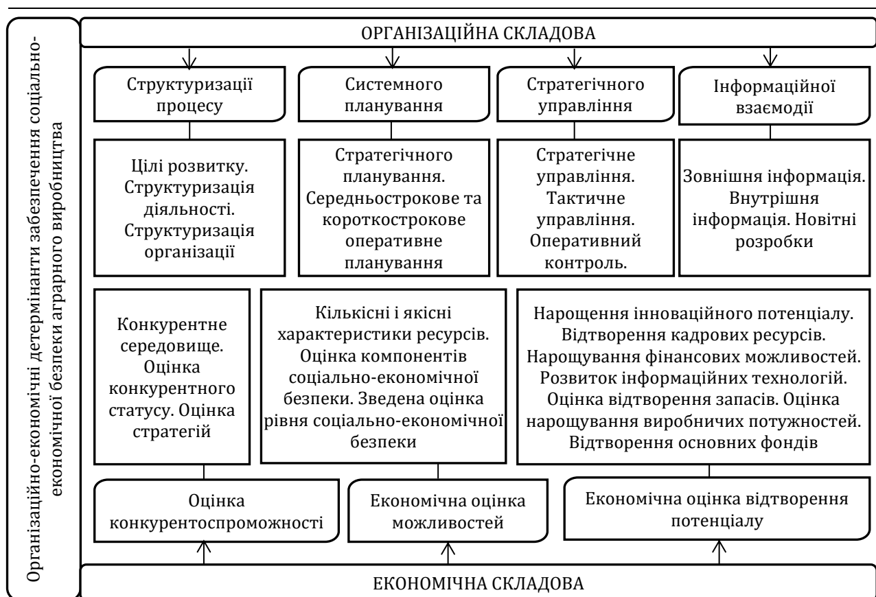
Рис. 2. Організаційно-економічні детермінанти забезпечення соціально-економічної безпеки аграрного виробництва