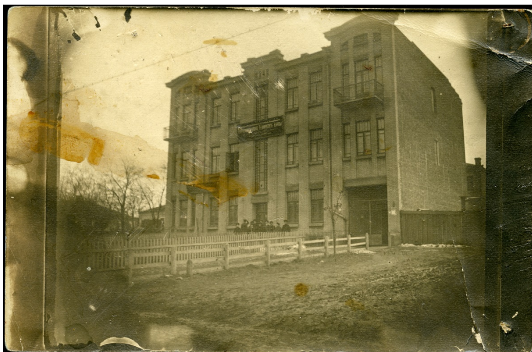
Рис. 1. Катеринославські Технічні Курси (Technikum) В. Х. Коробочкіна. У Катеринославі на розі вул. Скакової (тепер вул. Антоновича, 49) та Гімнастичної (нині – Шмідта.) Січень, 1913 рік

В Приватному Архіві Автора [ПАА] збереглася світлина тільки на початку своє існування нової триповерхової будівлі Катеринославських Технічних Курсів В. Х. Коробочкіна (рис. 1). Підтвердження тому – ще не прибрана огорожа будівельного майданчику.