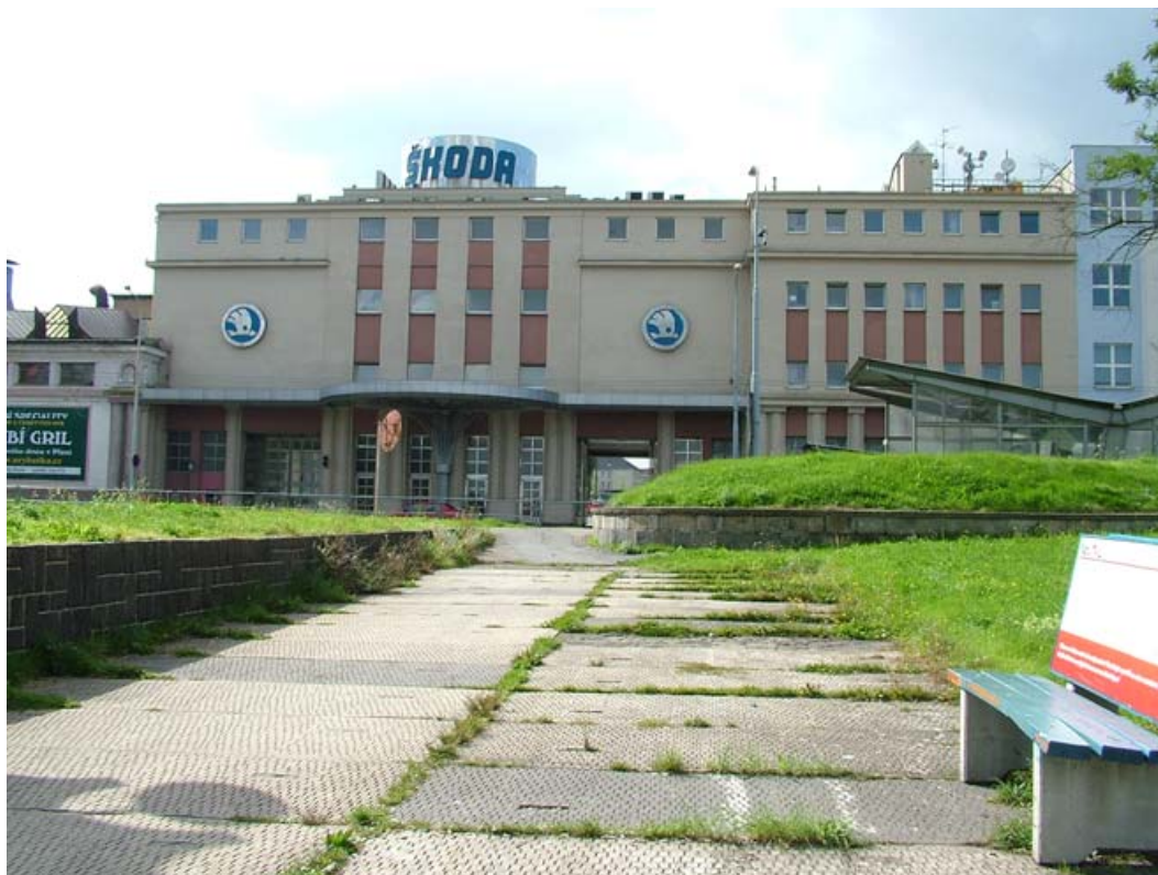
Рис. 4. Чехія, м. Пільзень. 2010. Будинок Управління акц. сусп. «Шкодові заводи»

Працював в мостобудівному відділенні як самостійний референт і як конструктор, виконував проекти та пропозиції до проектів Мостів: шосейних та залізничних, Металевих мостів різних перегонів, транспортних трубопроводів великих діаметрів, потужних підйомних пересувних кранів, підвісних канатних доріг, металевих споруд технічного призначення, як котельні, парові котли, ємності на електростанції, цукроварні, гаражі, котельні; будови громадського користування: кінотеатри, театри, панорамні видовища.