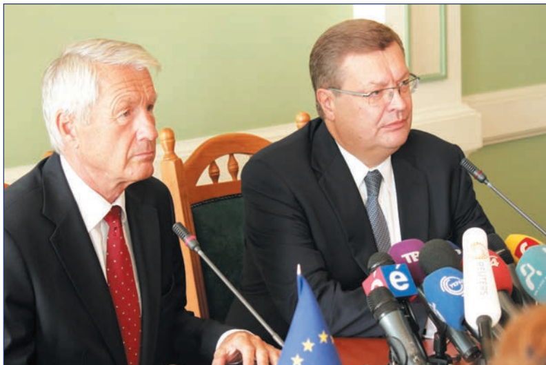
Міністр закордонних справ України Костянтин Грищенко та Генеральний секретар Ради Європи Торбйорн Ягланд. Київ, 10 вересня 2012 року

Finally, balance is not multi-vector nature. Balance means inner strength and clear understanding of what we want in combination with the ability to «hear the steps of Providence in the noise of history». Hugo once said that balance is the main law of the material world like justice is the main law of the spiritual world. Ukraine needs it in order to become modern European state developing in unison with the rest of the world.