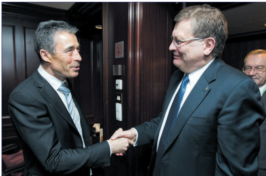
Зустріч Костянтина Грищенка з Генеральним секретарем НАТО Андерсом Фогом Расмуссеном. 26 березня 2012 р., Сеул Meeting of the Kostiantyn Gryshchenko with the Secretary General of NATO Anders Fogh Rasmussen. March 26, 2012, Seoul