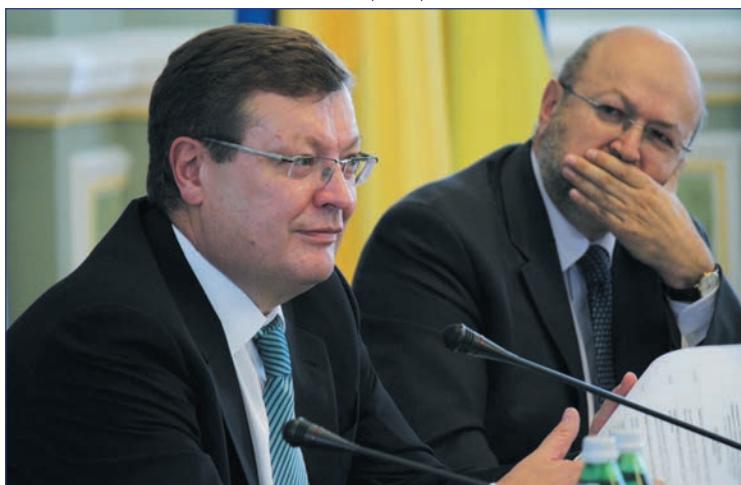
Костянтин Грищенко з Генеральним секретарем ОБСЄ Ламберто Занньєром. 2 жовтня 2012 р., Київ Kostiantyn Gryshchenko with the Secretary General of OSCE Lamberto Zannier. October 2, 2012, Kyiv